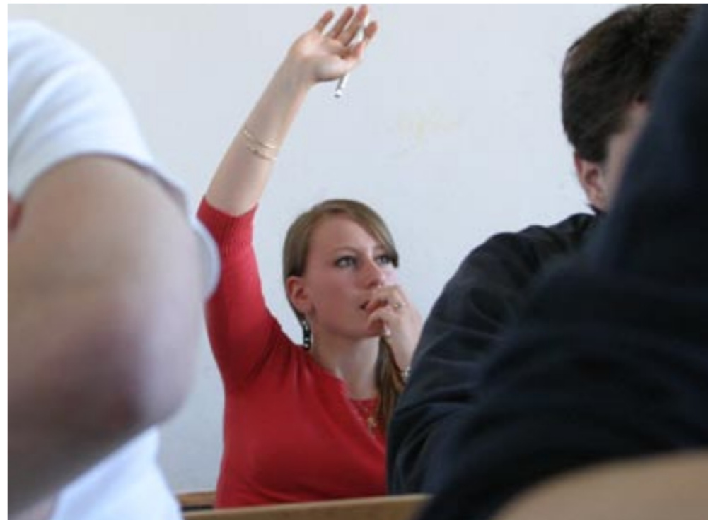
Noch Fragen? Stellen Sie Ihre Fragen jetzt, wenn Sie über den Wechsel in die gymnasiale Oberstufe nachdenken. Nur wer gut informiert ist, kann richtige Entscheidungen treffen.

se Einfluss auf Ihren persönlichen Fächerkanon. Viele der Fächer, die Sie bereits kennen, bleiben jedoch fundamental wichtig für alle - und deswegen Pflicht.