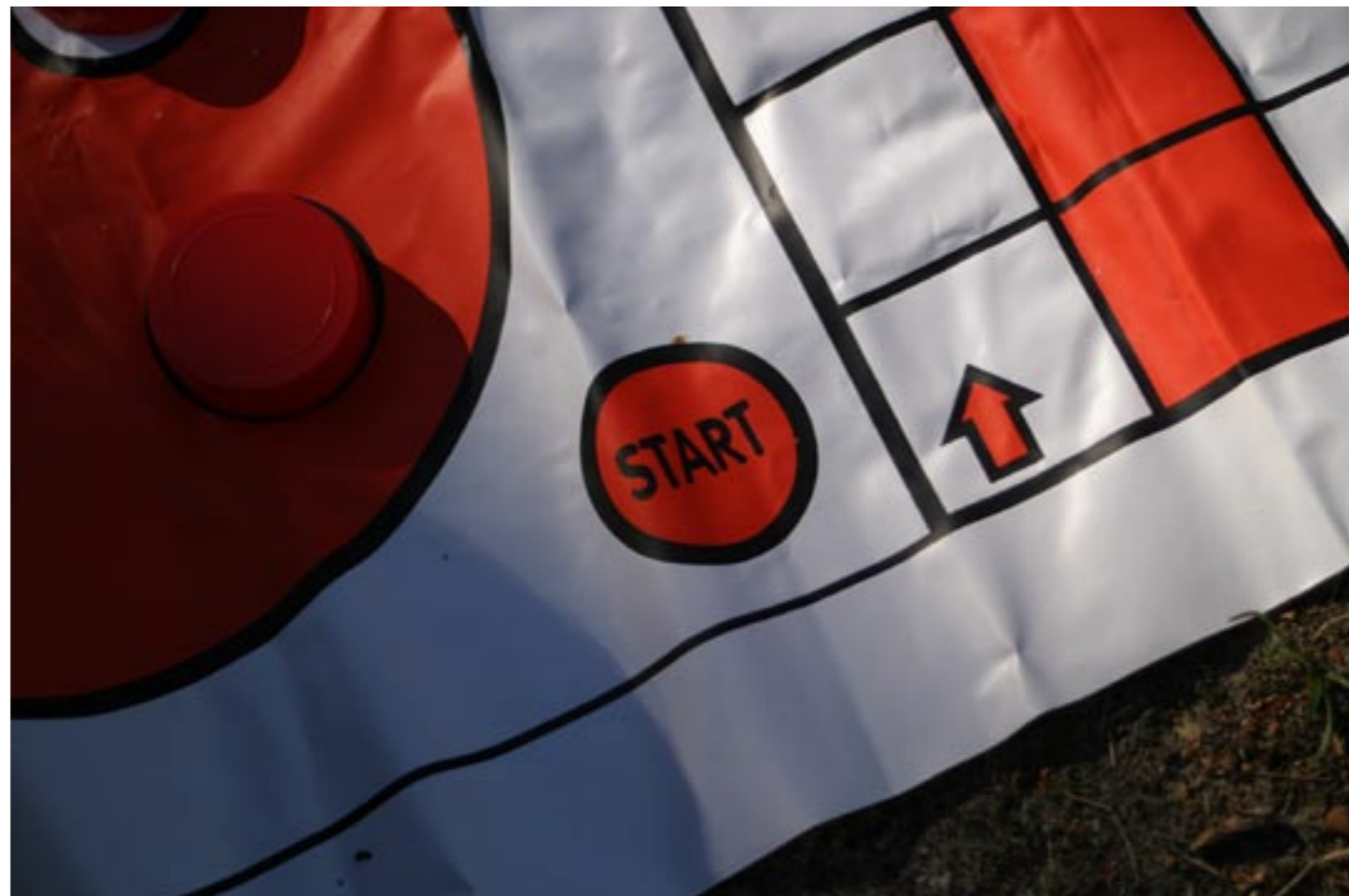
Lernen Sie die

Mit dem Abitur wird Ihnen die Allgemeine Hochschulreife bescheinigt, damit sollen Sie fit sein für jedes mögliche Studienfach an jeder Universität.