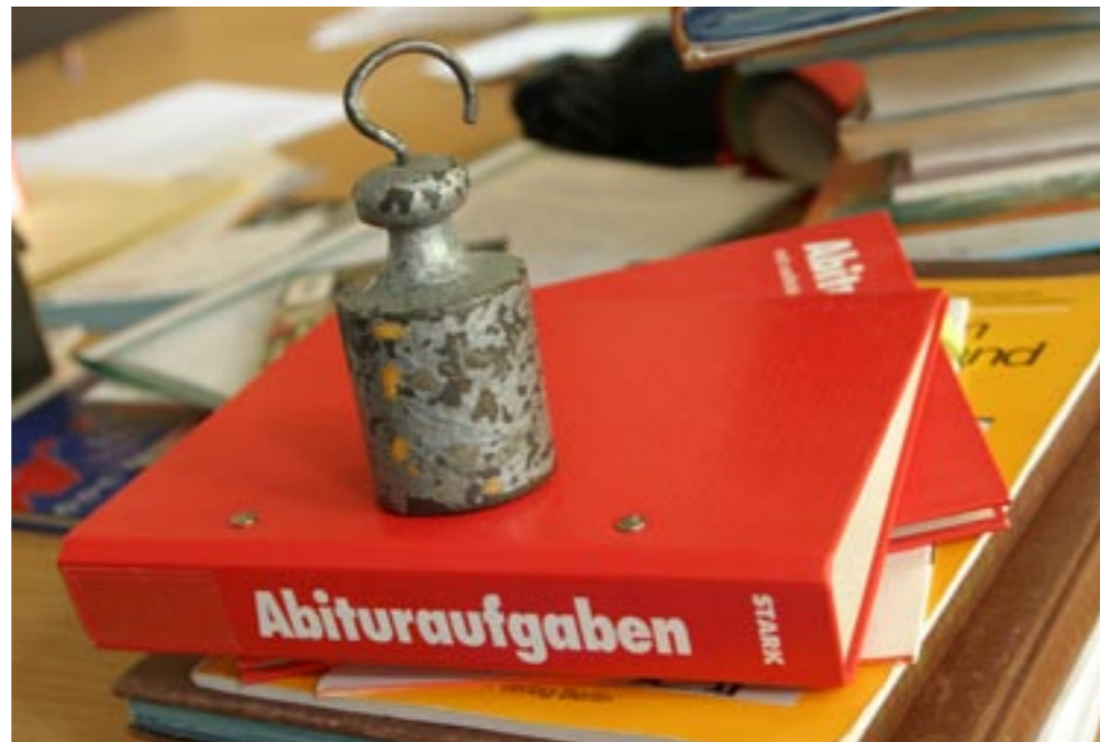
Wer den Weg zum Ziel sucht, braucht klare Orientierung. Das gilt besonders für Sie zu Beginn der gymnasialen Oberstufe.

Oft haben Sie die Wahl. Dann werden Sie ganz besonders merken, dass es für Ihren Erfolg auf Sie selbst ankommt, auf Ihr Können, Ihre Initiative und Ihre Entscheidungsfähigkeit. Kommen Sie also auf den richtigen Kurs. Finden Sie Ihre Fächer und behalten Sie Ihr großes Ziel vor Augen!