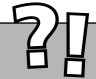
Durchschnittsnote für den schulischen Teil der Fachhochschulreife

? Wie unterscheidet sich die 5. Prüfungskomponente von den vier Prüfungsfächern?