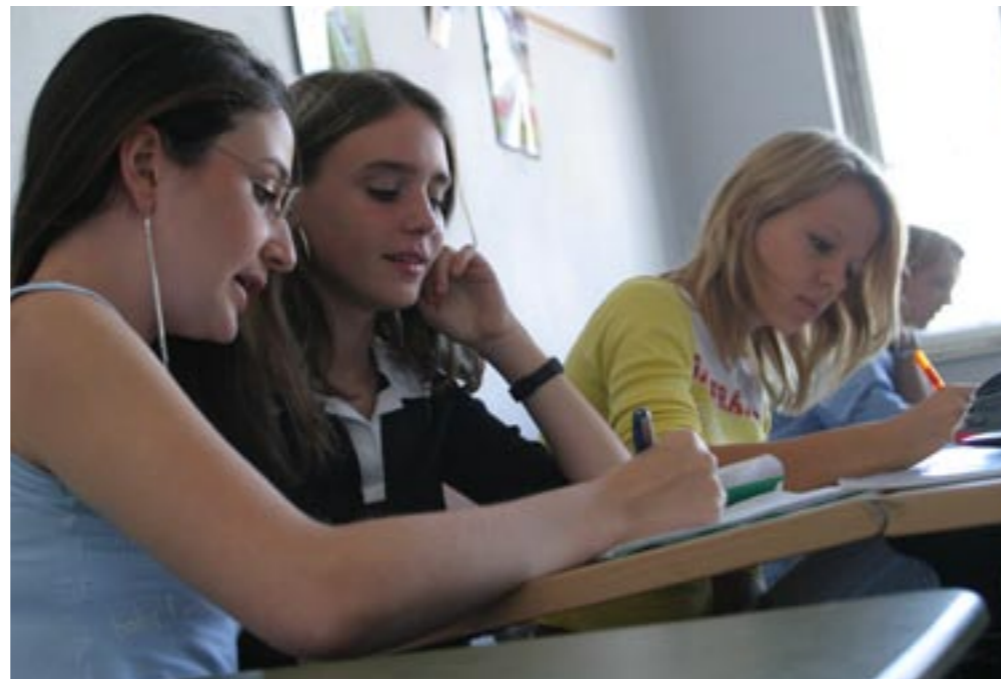
Erfolg kann man gemeinsam vorbereiten - wie die Schülerinnen im Mathematikunterricht an der Friedrich-Ebert-Schule.

zu zeigen, was in Ihnen steckt. An den neuen Modus der Leistungsbewertung werden Sie sich schnell gewöhnen und auch an die zeitlichen Grenzen, die diesem neuen „Punktesammeln“ gesetzt sind.