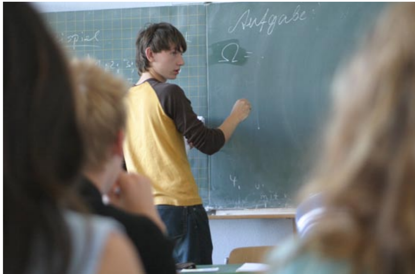
Die richtige Formel für Ihren Weg durch die gymnasiale Oberstufe bestimmen vor allem Sie - wenn Sie die Spielregeln dafür kennen.

Einige werden sich fragen: Warum soll ich mehr Kurse belegen, als ich als Pflichtgrundkurse einbringen muss? Es gibt gute Gründe dafür. Einerseits sollten die Möglichkeiten der gymnasialen Oberstufe genutzt werden, weitergehende Interessen zu verwirklichen, Schwerpunkte zu bilden oder Schwerpunkte zu ergänzen. Das Angebot einer Schule ist immer auch eine Chance für Sie - und für Ihr weiteres Leben.