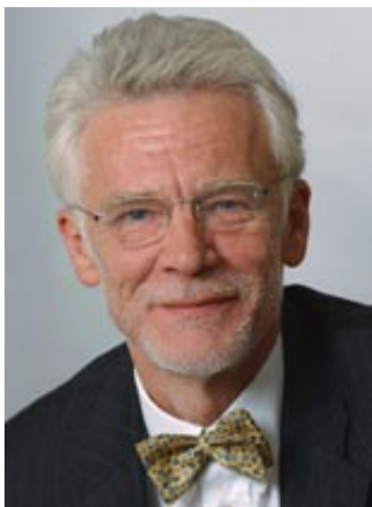
Prof. Dr. E. Jürgen Zöllner Senator für Bildung, Wissenschaft und Forschung

um das Abitur zu erwerben, werden Sie in Kürze die dreijährige gymnasiale Oberstufe beginnen. In einer zusammenwachsenden und globalisierten Welt ändern sich die Anforderungen ständig, die an Sie als junge Menschen gestellt werden. Die gymnasiale Oberstufe soll Sie optimal auf ein Studium oder den Einstieg in die Berufswelt vorbereiten und Ihnen damit beste Perspektiven für Ihre Zukunft gewähren.